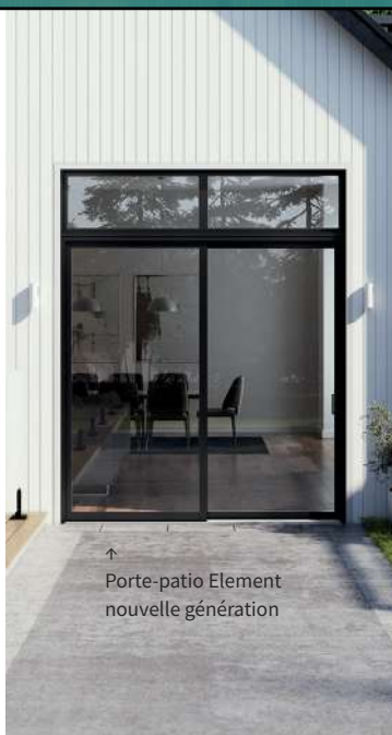
↑ Porte-patio Element nouvelle génération